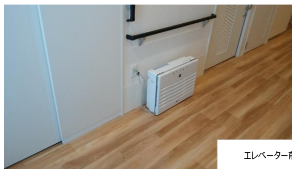
エレベーター前通路