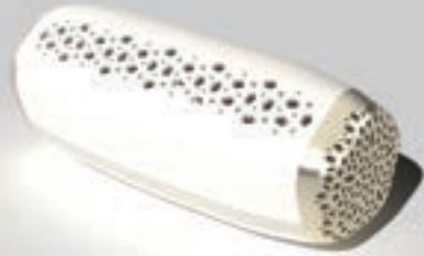
WARM WHITE / CHAMPAGNE GOLD