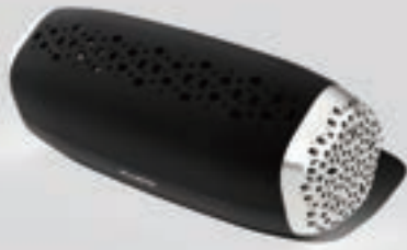
BLACK / SILVER